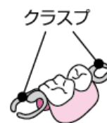
部分入れ歯(局部義歯)